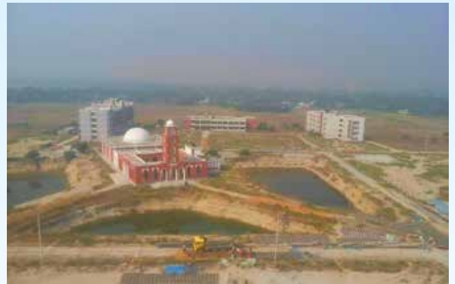
বারটান প্রধান কার্যালয়, আড়াইহাজার, নারায়ণগঞ্জ

বারটান- এর কার্যক্রম সুসংহত ও শক্তিশালীকরণের লক্ষ্যে ২০১৩ সালে বারটান-এর অবকাঠামো নির্মাণ ও কার্যক্রম শক্তিশালীকরণ প্রকল্পটি গ্রহণ করা হয়। এই প্রকল্পের আওতায় নারায়ণগঞ্জের আড়াইহাজার উপজেলায় ১০০ একর জমির উপর প্রধান কার্যালয় নির্মাণ করা হচ্ছে যেখানে ফলিত পুষ্টি বিষয়ক অত্যাধুনিক গবেষণাগার নির্মিত হয়েছে। প্রধান কার্যালয়সহ রংপুর (পীরগঞ্জ), সিরাজগঞ্জ, বিনাইদহ, বরিশাল, সুনামগঞ্জ, নোয়াখালী আঞ্চলিক কার্যালয়ের অবকাঠামো নির্মাণ করা হচ্ছে। ইতিমধ্যে প্রধান কার্যালয়-এর অফিস ভবনসহ ০৭ আঞ্চলিক কার্যালয়ের সম্পূর্ণ কাজ সম্পন্ন হয়েছে। প্রধান কার্যালয়ের প্রশিক্ষণ ভবনের নির্মাণ কাজ সম্পন্ন হয়েছে।